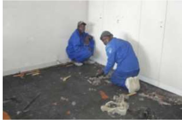
Les travaux de rénovations ont commencé le 25 mars 2009.