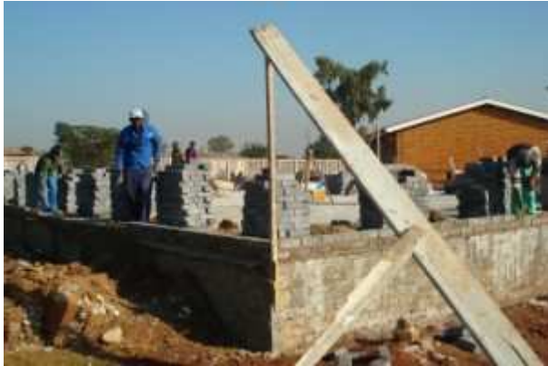
10 mai 2009