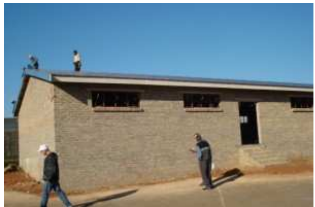
29 mai 2009