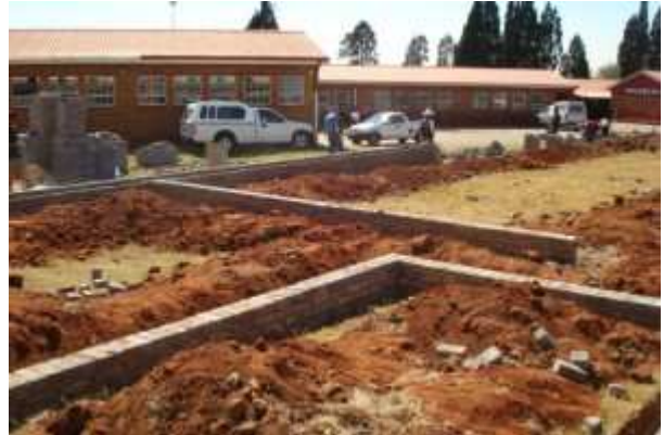
Les travaux de constructions ont commencé le 14 avril 2009.