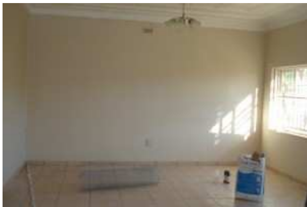
lounge 17 mai 2009