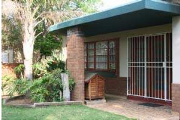
Maison achetée pour être rénovée afin de faire office d'hospice