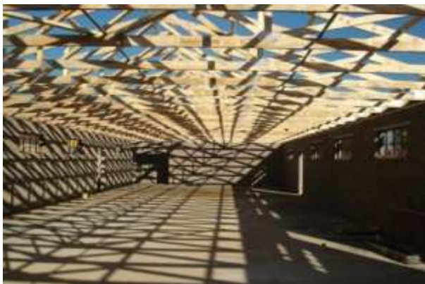
26 mai 2009