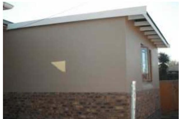
nouvelle annexe chambre et chambre d'isolement & salle de bains 4 juin 2009