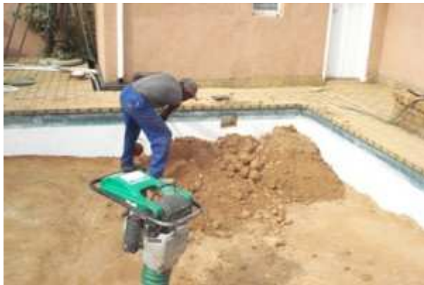
6 avril 2009