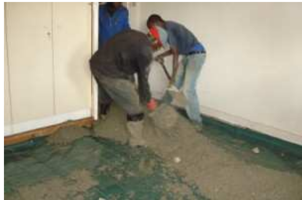
9 avril 2009