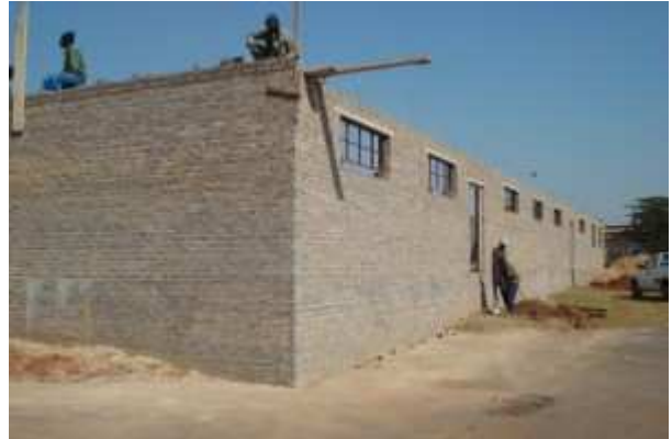
19 mai 2009