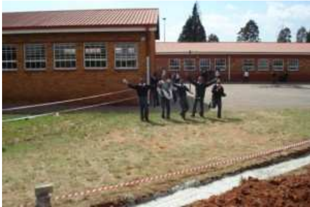
La mise en place du projet a été entamée. Ecole primaire de Mogobeng.